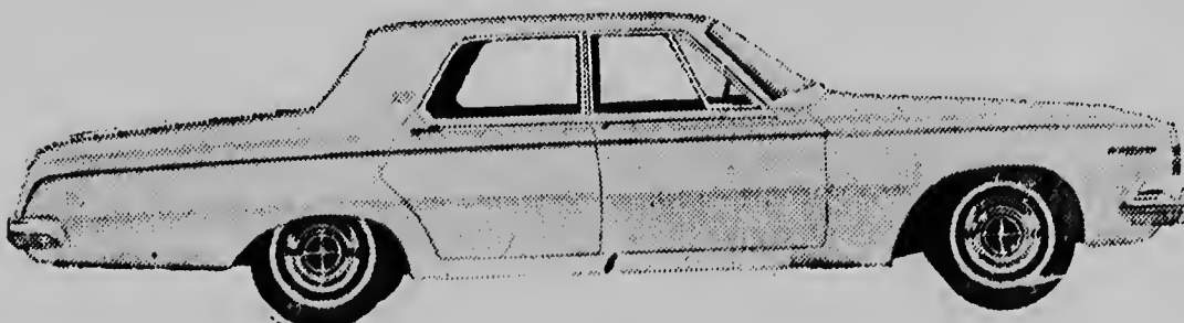
1963 DODGE 330